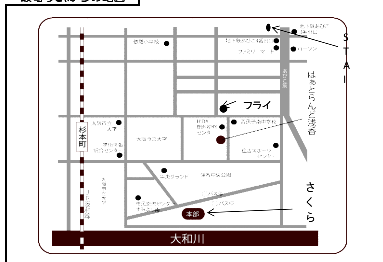
最寄り駅からの略図

地下鉄あびこ駅3番出口を出て南に約800m。阪和線杉本町駅東出口を出て、東へ約600m。