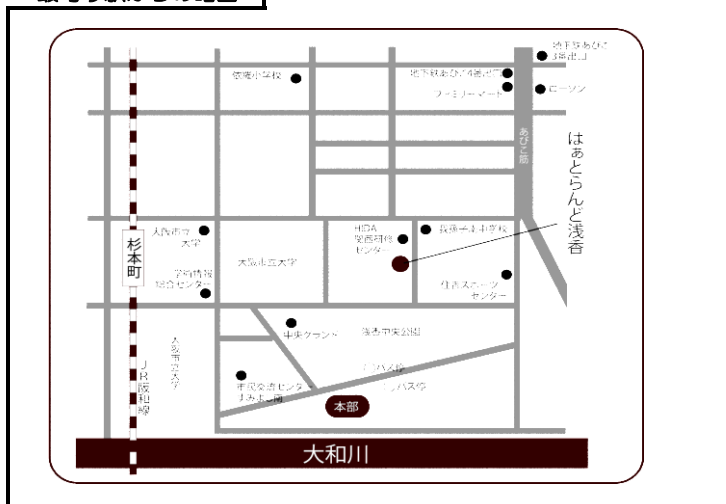
最寄り駅からの略図

地下鉄〇〇駅1番出口を出て西に300M。〇〇交差点を北に50M歩いたところにある〇△ビルの4階です。